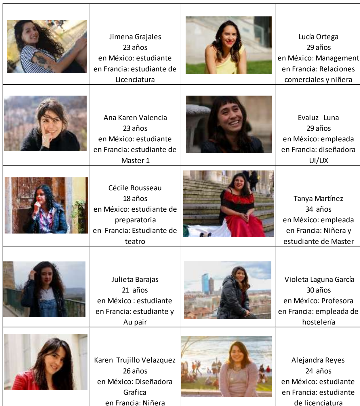
Figura 2. Mujeres mexicanas entrevistadas

Nota: Elaboración propia Lyon, Francia 2019