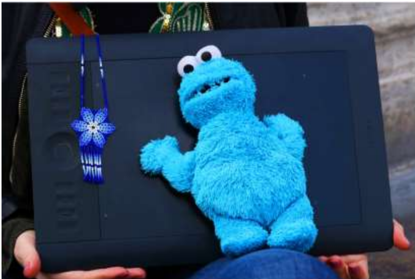
Fotografía 23 y 24. Luna