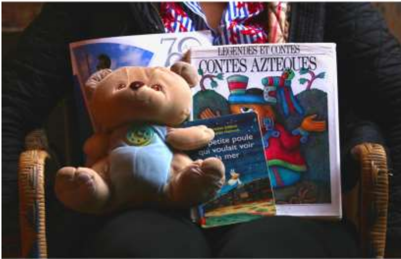
Fotografía 21 y 22. Cécile