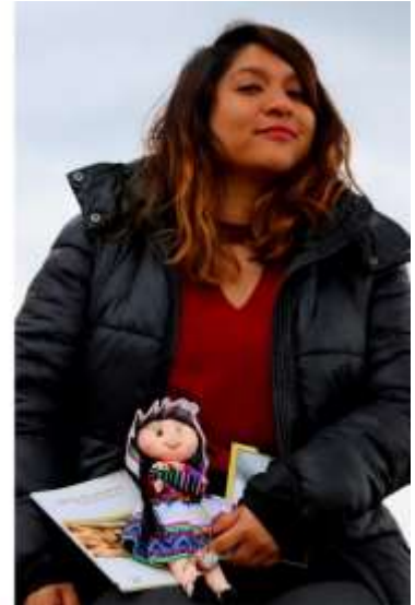
Nota: Serie Violeta Lyon, Francia 2019