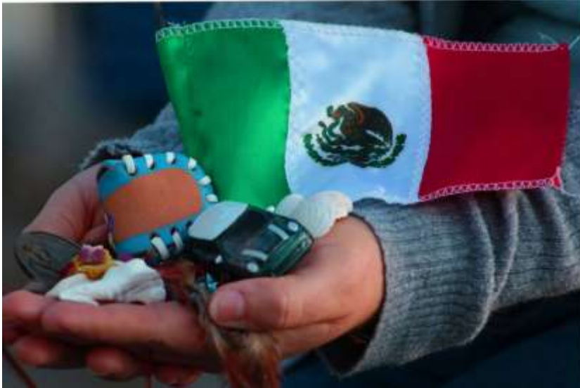
Fotografía 17 y 18. Alejandra